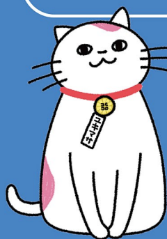
「日本行政書士会連合会」 公式キャラクター 行政(ユキマサ)くん